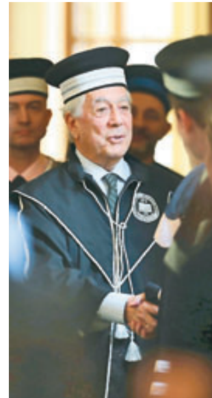
El escritor durante la entrega del título.

BUCAREST. Mario Vargas Llosa recibió ayer el título de “doctor honoris causa” de la Universidad “Babes-Bolyai” de Cluj, en Rumanía, ante la que dijo que “la literatura tiene el papel de dar sentido al mundo y de enriquecer la vida”. “Se trata de un reconocimiento que implica una obligación en el futuro de trabajo intelectual y cívico”, señaló el autor en su discurso, citado por la agencia de noticias Medifax. “Siempre escribiré, no puedo parar de escribir. Es un honor para mí recibir...”, indicó. —EFE